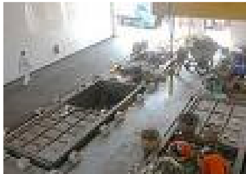
Hình 6.1: Cấu tạo bên trong trạm trung chuyển.

Trạm trung chuyển được sử dụng để trung chuyển chất thải rắn từ xe thu gom và những xe vận chuyển nhỏ sang các xe vận chuyển lớn hơn. Tùy theo phương pháp sử dụng để chất chất thải rắn lên xe vận chuyển, có thể phân loại trạm trung chuyển thành 3 loại như sau: (1) chất tải trực tiếp, (2) chất tải lưu trữ và (3) kết hợp chất tải trực tiếp và chất tải thải bỏ. Trạm trung chuyển có thể được phân loại theo mục đích phục vụ: (1) Loại phục vụ cho những xe thu gom ban đầu như những xe thủ công, những xe có động cơ nhỏ. (2) Loại phục vụ cho những xe lớn hơn, thường là những xe cơ giới .