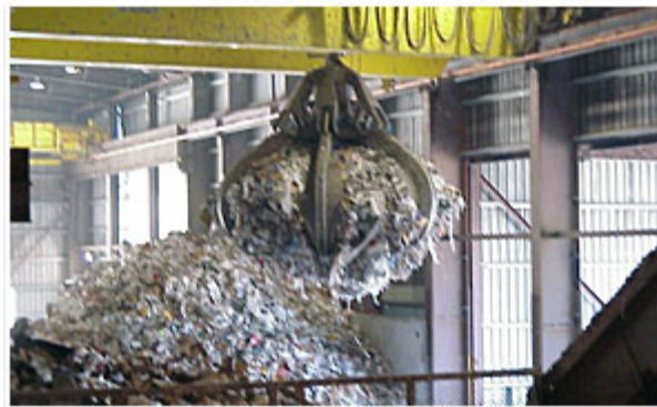
Hình 6.2: Cần cẩu chất thải rắn trong trạm trung chuyển

Thiết bị và các dụng cụ phụ trợ sử dụng ở trạm trung chuyển phụ thuộc vào chức năng của trạm trung chuyển trong hệ thống quản lý chất thải rắn. Một số thiết bị cần sử dụng để đẩy chất thải vào xe vận chuyển hoặc để phân bố đều chất thải trên các xe vận chuyển, thiết bị để đập vụn và đẩy chất thải vào phễu nạp liệu. Một số thiết bị khác cần dùng để phân bố chất thải và làm đồng đều tải trọng trên xe vận chuyển. Chúng loại và số lượng thiết bị, dụng cụ yêu cầu thay đổi theo công suất của trạm.