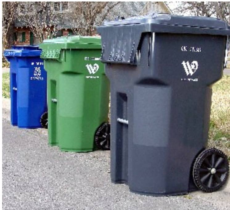
Hình 3.4: Các thùng chứa rác được đặt trong khu dân cư để thu gom định kì.

Nhìn chung, nếu dịch vụ thu gom không bị hạn chế, chất thải sẽ được thu gom nhiều hơn. Tuy nhiên, kết luận này không được phép áp dụng để suy luận rằng lượng chất thải sinh ra sẽ nhiều hơn. Ví dụ, nếu hộ gia đình chỉ có một hoặc hai thùng chứa rác trong một tuần, do giới hạn sức chứa của thùng, họ sẽ cất riêng báo và những vật liệu khác; trong khi đó, nếu dịch vụ thu gom không hạn chế, chủ hộ có khuynh hướng thải bỏ luôn cả những thành phần này. Trong trường này, lượng chất thải sinh ra có thể giống nhau, nhưng lượng chất thải thu gom được sẽ rất khác nhau. Như vậy, vấn đề cơ bản là ảnh hưởng của tần xuất thu gom đến sự phát sinh chất thải vẫn chưa được giải đáp.