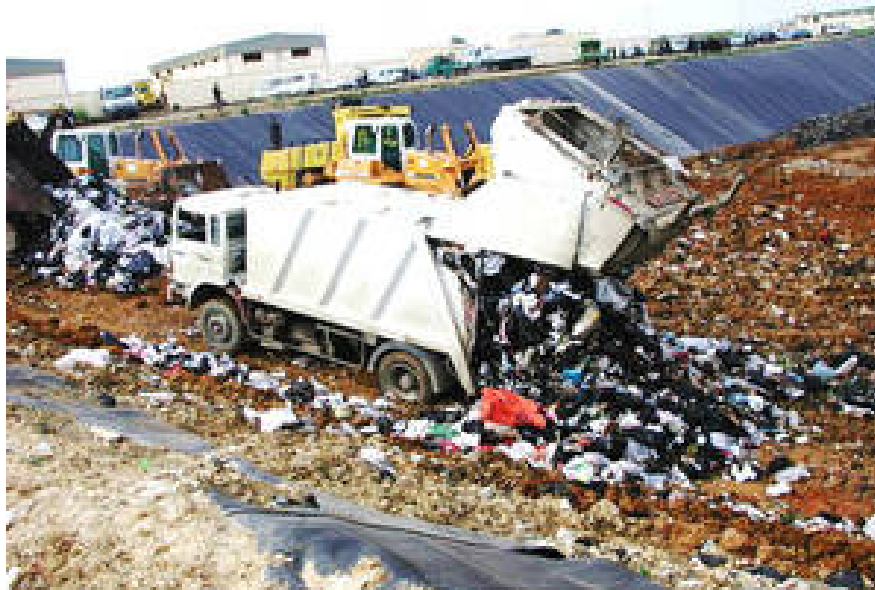
Hình 3.1: Xe thu gom đổ bỏ chất thải rắn tại bãi chôn lấp.

Theo phương pháp này, số lượng xe vận chuyển và tính chất chất thải tương ứng (loại chất thải, thể tích ước tính) được ghi lại trong một khoảng thời gian nhất định, cũng có thể cân và ghi lại số liệu. Tốc độ phát sinh chất thải được xác định dựa trên số liệu thực tế và nếu cần thiết có thể sử dụng số liệu đã công bố.