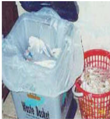
Hình 3.3: Người dân phân loại chất thải tại nguồn để tái sinh

Chương trình tái sinh chất thải của khu dân cư hoạt động sẽ ảnh hưởng đến lượng chất thải thu gom để tiếp tục xử lý hoặc thải bỏ.